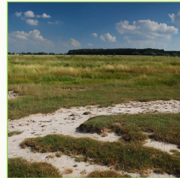
Slaniska a rašeliniště: 1340, 7110