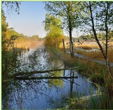
Lesy: 91D0, 91E0, 91N0