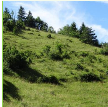
Travnatá stanoviště: 1530, 6110, 6120, 6210, 6250, 6260